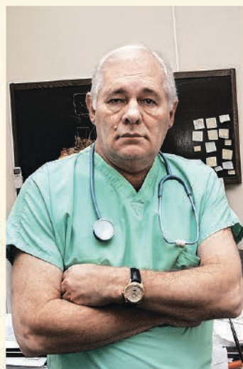
Детский доктор мира 85 лет Леониду Рошалю

Леонид Михайлович Рошал, выдающийся детский хирург, родился в городе Ливны Орловской области в семье военного лётчика.