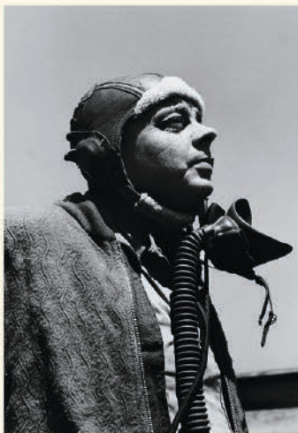
Антуан де Сент-Экзюпери Отец «Маленького принца»

Антуан де Сент-Экзюпери родился 29 июня 1900 года в Лионе (Франция). В 1925 году Экзюпери становится авиапилотом «Аэропосталь». С середины 1930-х годов занимается журналистикой. В 1941–1943 годах Экзюпери проживал в США, где и была написана его известнейшая книга «Маленький принц». С началом Второй мировой войны он вновь становится пилотом. 31 июля 1944 года Антуан де Сент-Экзюпери не вернулся из разведывательного полёта.